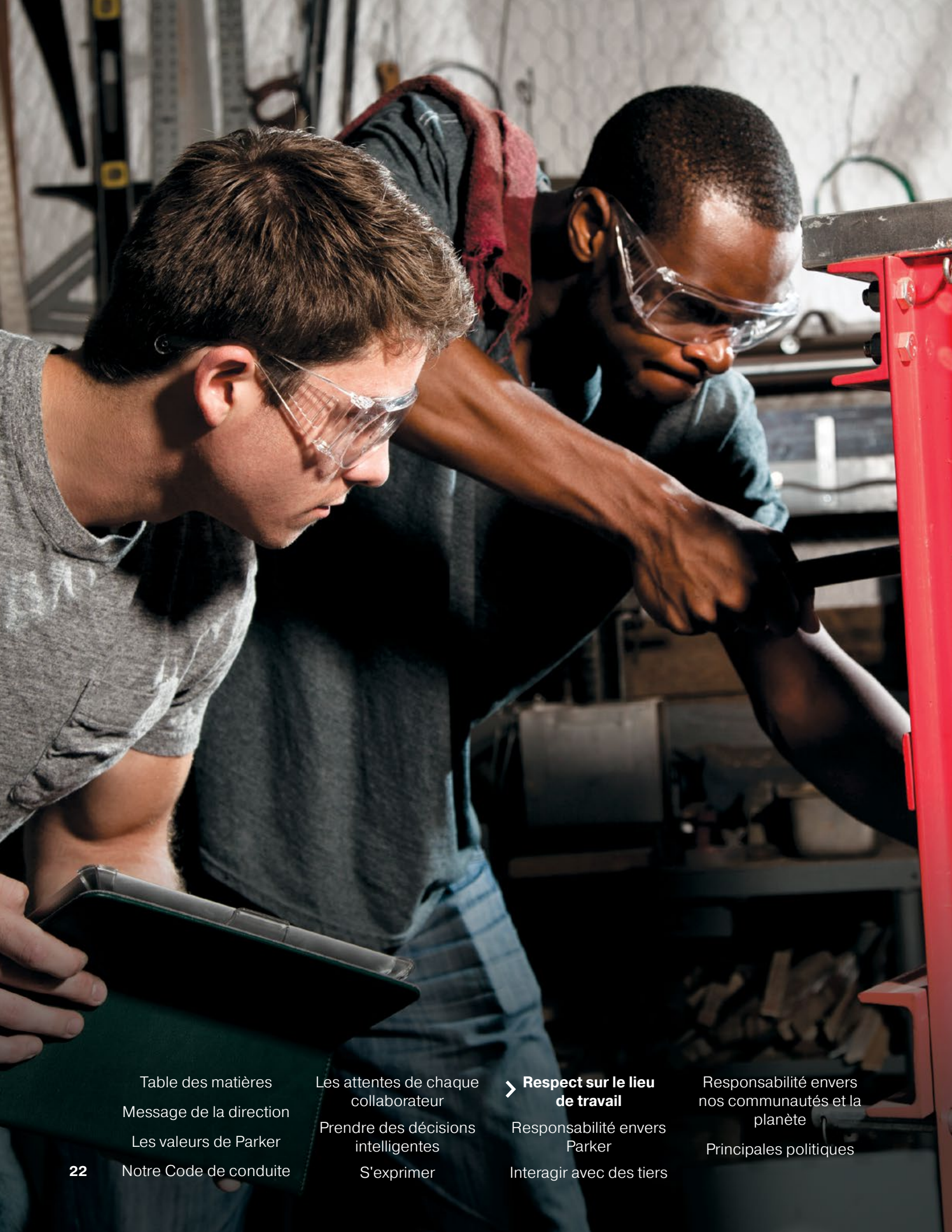
Table des matières Message de la direction Les valeurs de Parker Notre Code de conduite

Les attentes de chaque collaborateur Prendre des décisions intelligentes S'exprimer