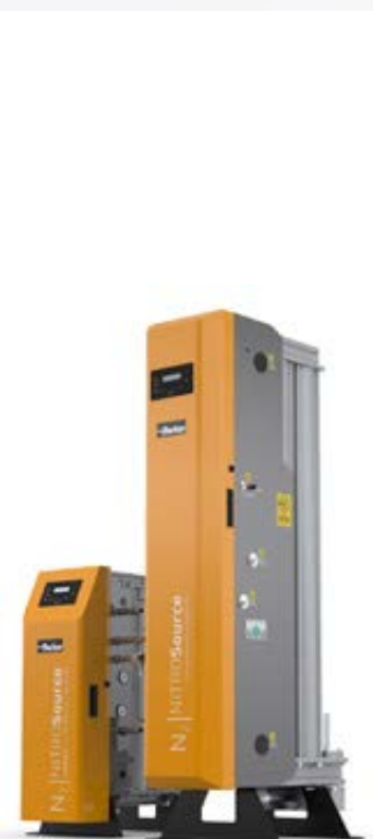
Générateurs d'azote Parker NITROSource et NITROSource Compact