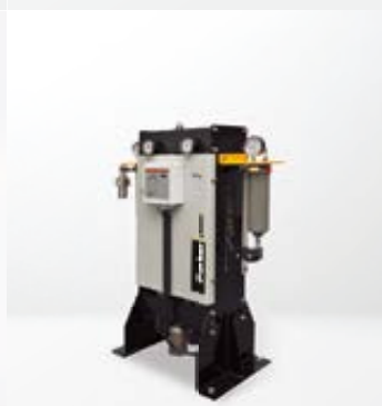
Sécheurs haute pression Parker