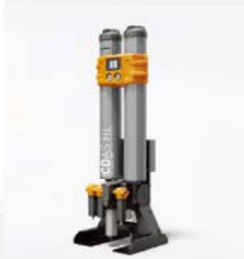
Sécheurs à adsorption Parker