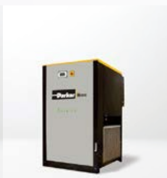
Sécheurs hybrides et par réfrigération Parker