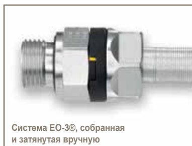
Система EO-3®, собранная и затянутая вручную

Данный практический опыт навел на мысль о разработке соединительной системы EO-3®, которая легко и однозначно отображает состояние монтажа, которое видимо с любой точки снаружи. Такая разработка ставит любого пользователя в положение, когда он может выполнить монтаж с высокой точностью, и очень быстро определить качество соединений; он также имеет возможность визуальной приемки в конце сборочного конвейера.