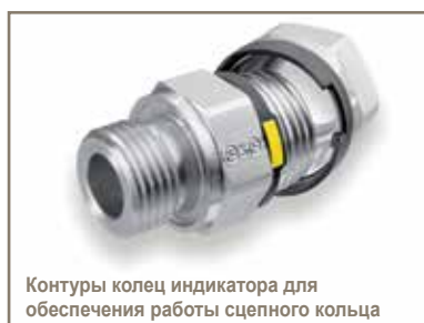
Контуры колец индикатора для обеспечения работы сцепного кольца