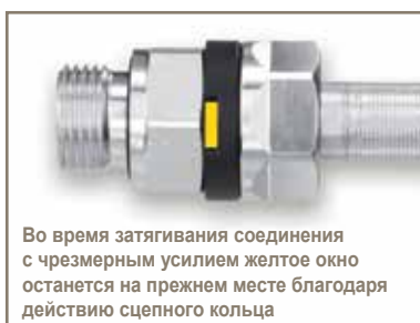
Во время затягивания соединения с чрезмерным усилием желтое окно останется на прежнем месте благодаря действию сцепного кольца