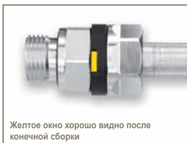
Желтое окно хорошо видно после конечной сборки