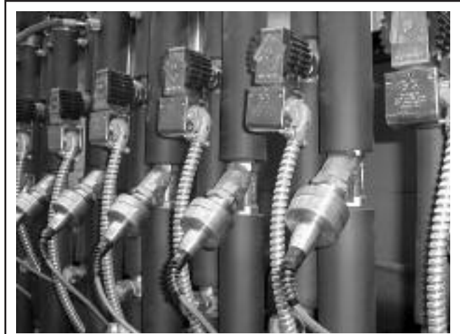
Aunque los controladores de temperatura en mostradores fueron los primeros en el mercado, controladores RACK están aumentando en popularidad debido a su menor costo y habilidad de controlar múltiples válvulas.

Para información adicional, contacte a Sporlan, Division of Parker Hannifin o a su distribuidor local o refiérase a los boletines de productos de la serie -100.