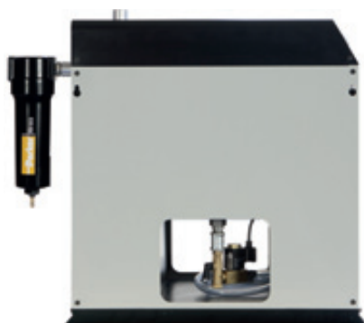
Una nicchia passante permette un facile accesso allo scaricatore da entrambi i lati