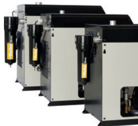
Opzione con pre-filtro (non fa parte della dotazione standard)