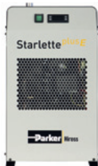
Dotato di controllo digitale