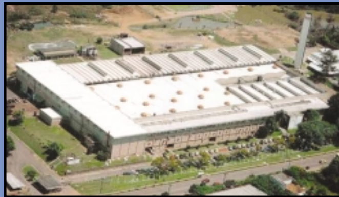
Planta da Parker em Cachoeirinha, RS

Porque a performance dos produtos da Parker adiciona valor aos seus próprios produtos. Líder em qualidade de produto, performance de entrega e serviço ao cliente, a Parker Hannifin é a marca com a qual você pode contar.