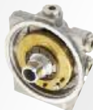
▶ GRZAŁKI W GŁOWICACH RACORA

Racor jako jeden z pierwszych zintegrował grzałki paliwa w filtrach, co stało się teraz standardem.