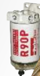
▶ RACOR R90P

Nowe silniki Forda serii E i F Navistar są wyposażone w rewolucyjne filtry serii Spin-On produkcji Parker Racor.